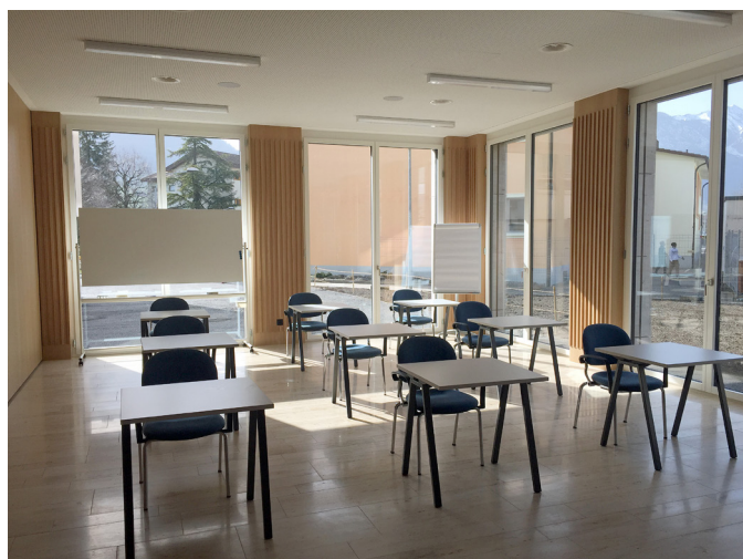
Saal Buochli (Schulungsraum / max. 24 Personen) Raumgrösse: 9.00 x 6.00 m