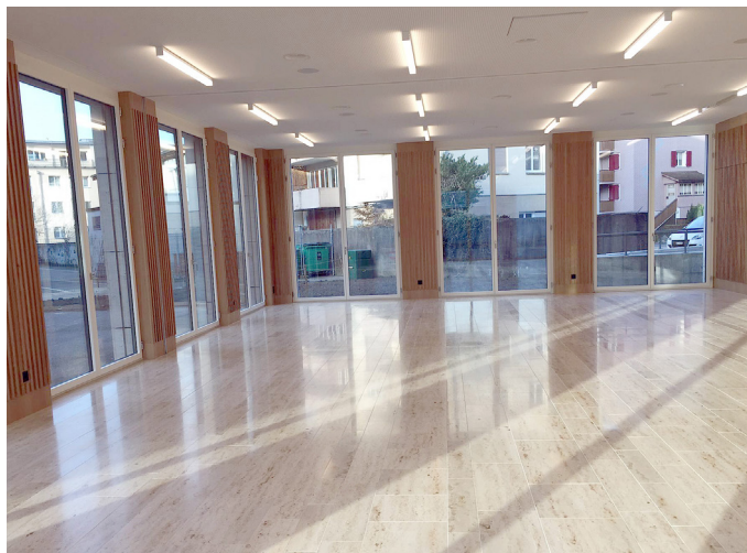
Säle St. Jost und Buochli (max. 108 bis 120 Personen) Raumgrösse: 9.00 x 15.50 m

Die grosszügigen Säle St. Jost und Buochli können vielseitig genutzt werden, wie für Apéro, Geburtstagsfeste, Ausstellungen, Konzerte mit kleinen Formationen, Kurse etc.