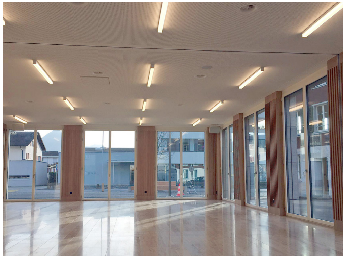
Saal St. Jost (max. 72 Personen) Raumgrösse: 9.00 x 9.30 m